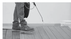
APPLIQUER SANSIN SDF AU PINCEAU OU AU PISTOLET