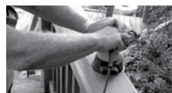
PONÇAGE AVEC UN PAPIER ABRASIF DE CALIBRE 60-80