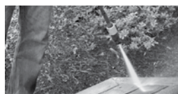
LAVER AVEC UNE PRESSION DE 3000 PSI