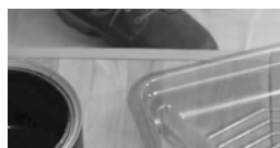
BIEN MÉLANGER AVANT ET PENDANT L'APPLICATION